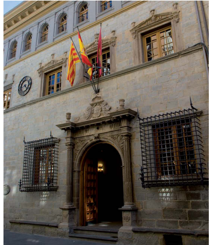
Fachada del Ayuntamiento, recientemente restaurada.

En el interior se guardan valiosas joyas históricas dado que cuenta con uno de los mejores archivos municipales de Aragón con documentos desde 1042, entre otros, el famoso códice El Libro de la Cadena del S. XIII.