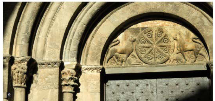
1. Interior de la Catedral y Altar Mayor./ 2. Tímpano con el Crismón.

El acceso lateral o sur, es posterior, además de su portada y los preciosos capiteles románicos, conserva la “vara jaquesa”.