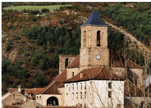
ECHO. Iglesia parroquial de San Martín

Templo de orígenes románicos, solo conservamos el ábside y parte de la espadaña, al ser incendiado por las tropas napoleónicas. En 1829 se recreó en estilo neoclásico, alberga valiosos retablos procedentes del Convento de los Mercedarios del Pilar de Embún.